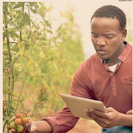
Agricoltura. Tra i progetti della cooperazione allo sviluppo c'è il rafforzamento della produzione nei Paesi in via di sviluppo