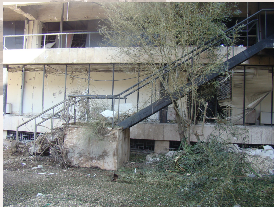
L'emplacement de l'obus tombé sur la statue