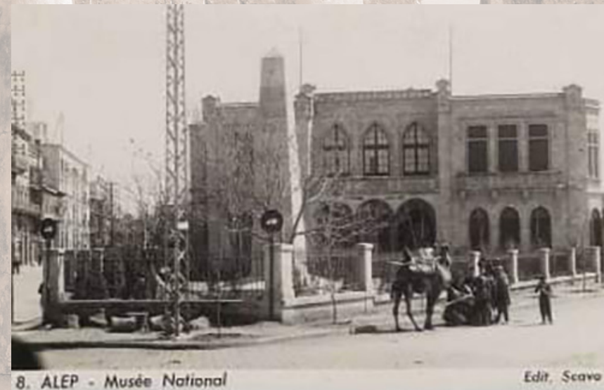
Le premier musée d'Alep, connu sous le nom de Palais Naoura