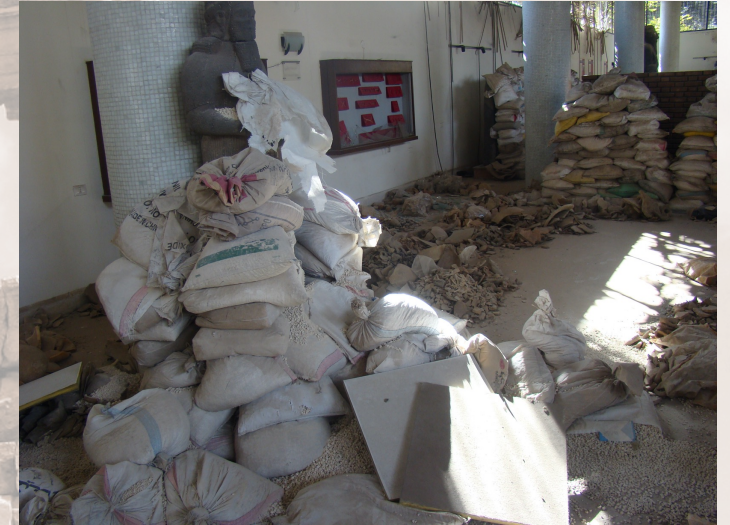
Destruction du musée d'Alep après avoir libéré la ville et l'avoir atteinte