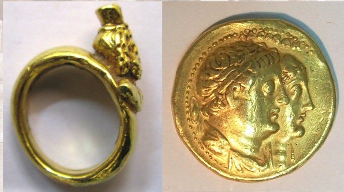
Transfert de pièces importantes et rares à la Banque centrale de Syrie