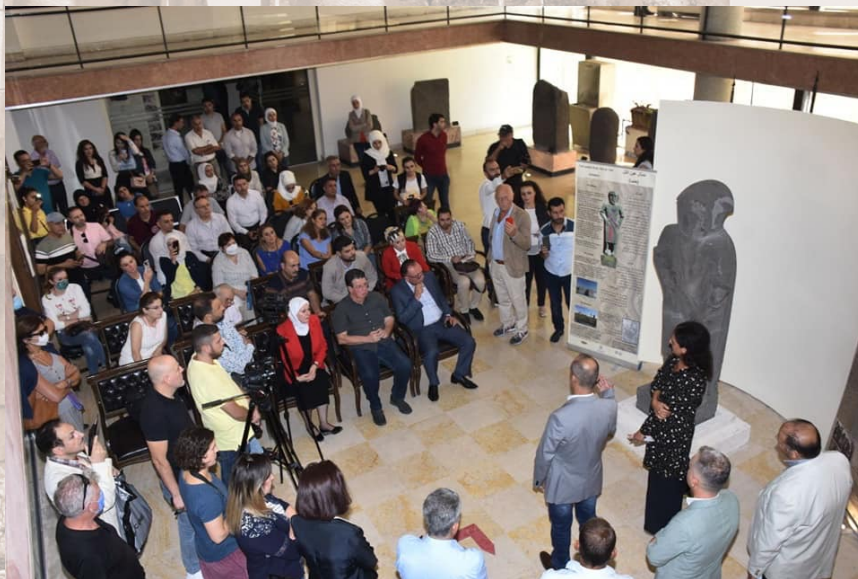
La statue a été exposée après sa restauration par l'équipe italienne au Musée d'Alep