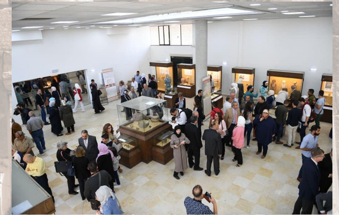
Restauration et ouverture de certaines salles du Musée d'Alep en 2019