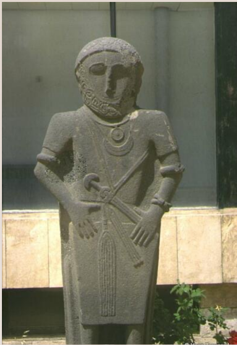
La statue avant la chute de l'obus