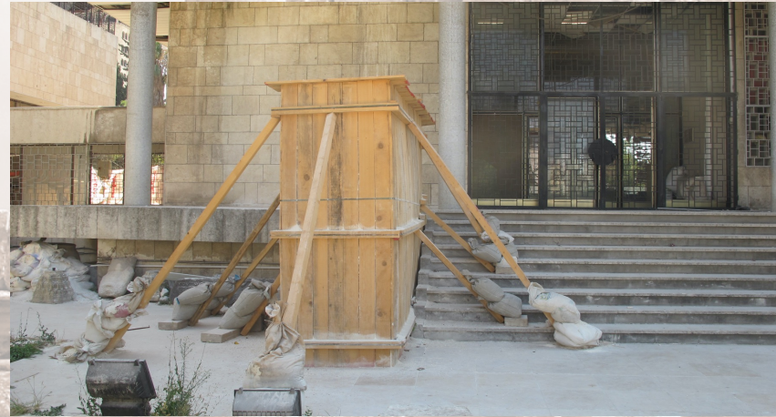
Exemples de murs en ciment et en bois construits autour des objets pour les protéger