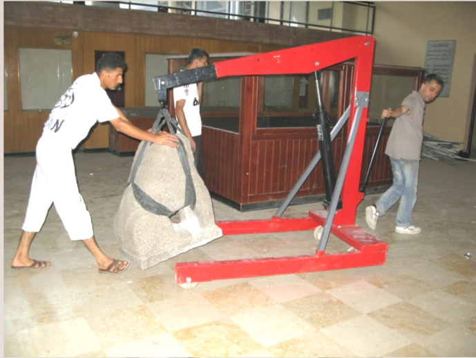
Déplacer les statues du parc vers le musée