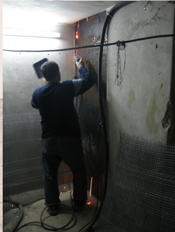
Renforcement des portes et serrures d'entrepôt