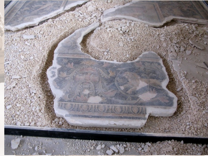
Démontage et transport du panneau mosaïque