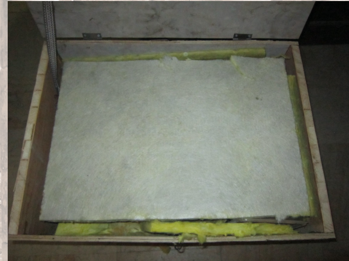
Utilisez des panneaux de mousse au plafond pour protéger les pièces à l'intérieur des boîtes