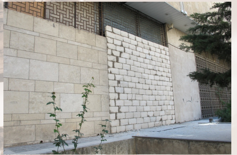
Toutes les portes extérieures du musée sont fermées par des murs