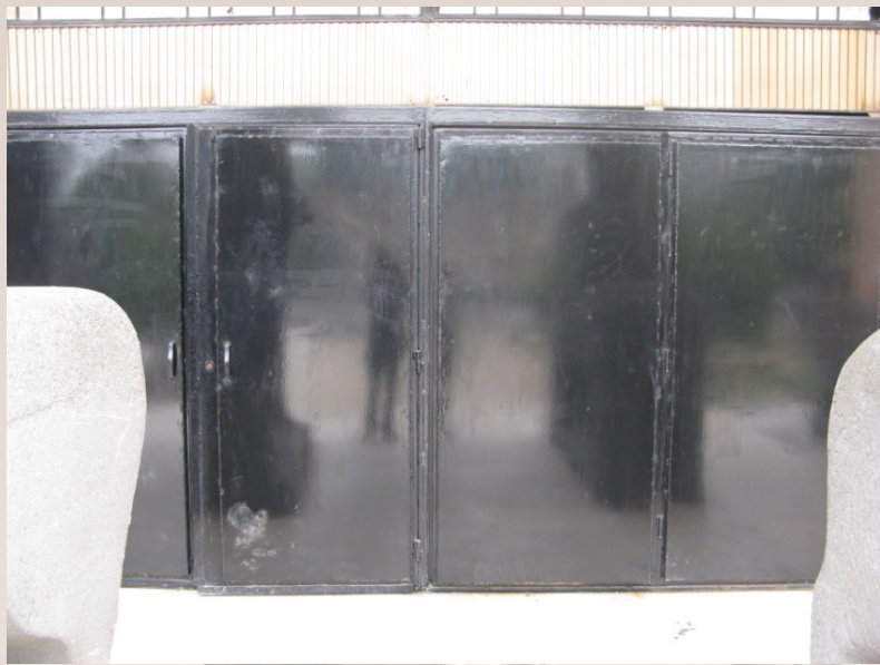
Les fenêtres sont renforcées par des panneaux métalliques