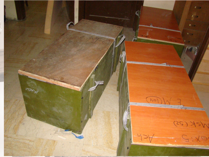
Fabrication de caisses en bois disponibles au musée